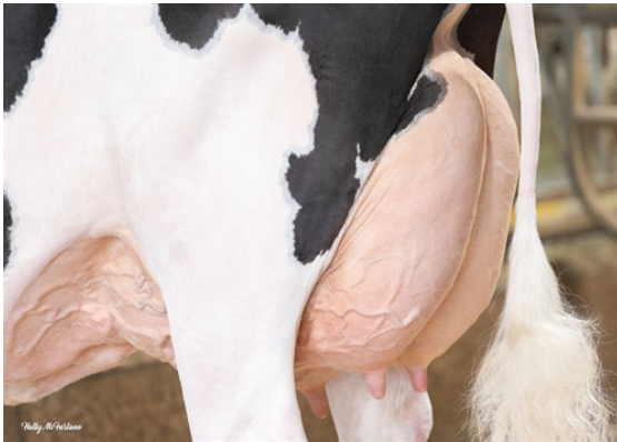
MYSTIQUE LAMBDA ANIS DAM