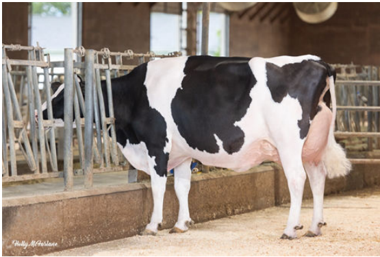
MYSTIQUE LAMBDA ANIS DAM