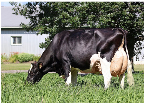
MYSTIQUE EXTREME ABRICOT GRANDDAM